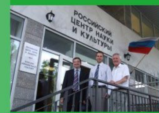
Center of Russian Science and Culture in Warsaw

Мы специализируемся в области образовательного консалтинга в Польше и за рубежом - от языковых курсов до университетских и профессиональных программ для людей различных возрастов. За это время у нас сложились добрые отношения с университетами, школами, колледжами, зарубежными компаниями, лингвистическими центрами, позволяющие удовлетворить практически любой запрос клиента.