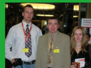
Alma Mater Education Fair in Moscow, 2006

Все наши партнеры в Польше, Великобритании, США, Канаде, Мальте, Австралии признаны и аттестованы своими Министерствами просвещения или соответствующими органами, имеющие высокий авторитет в области образования.